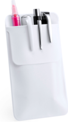
3502 - DOKTOR CEP KALEMLİĐİ