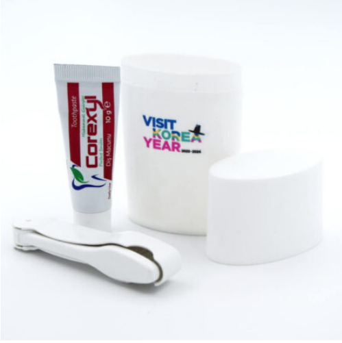
3512 - PROMOSYON DIŞ SETİ