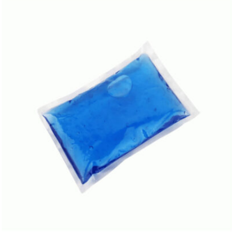
3505 - SOĞUTUCU JEL