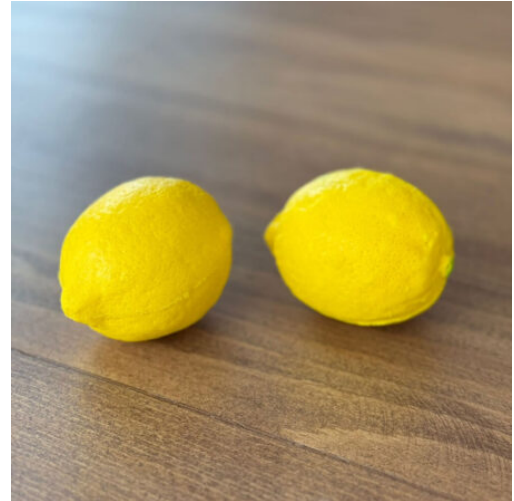
3521 - LIMON STRES TOPU