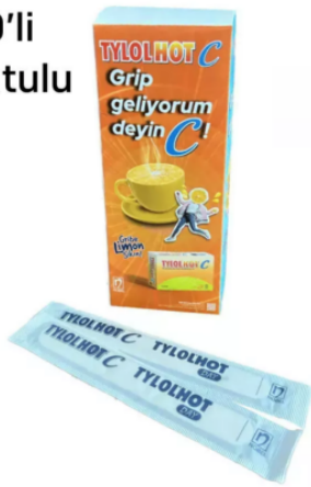
3515 - PEDIATRİK ABESLANG