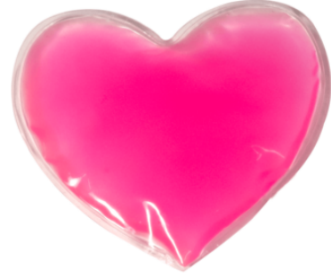
THERMO JEL KALP