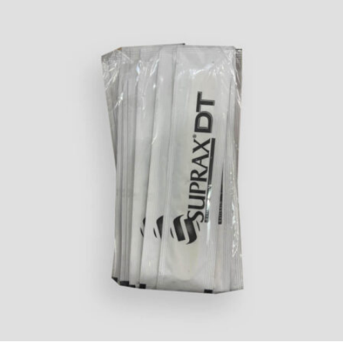
3516 - PEDIATRİK ABESLANG JELATİNLİ