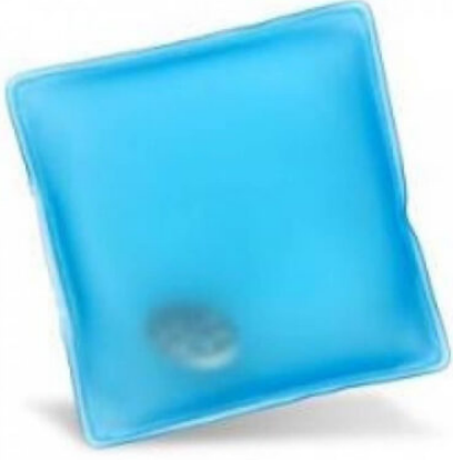
3506 - EL CEP SOBASI