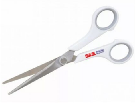
3215 - MAKAS