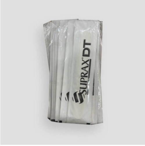
3516 - PEDIATRİK ABESLANG JELATİNLİ