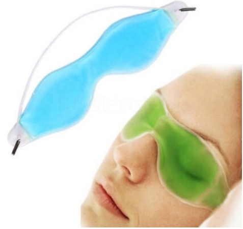
3508 - JEL GÖZ TERAPI MASKESİ