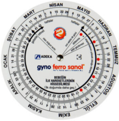
3527 - GEBELİK ÇARKI